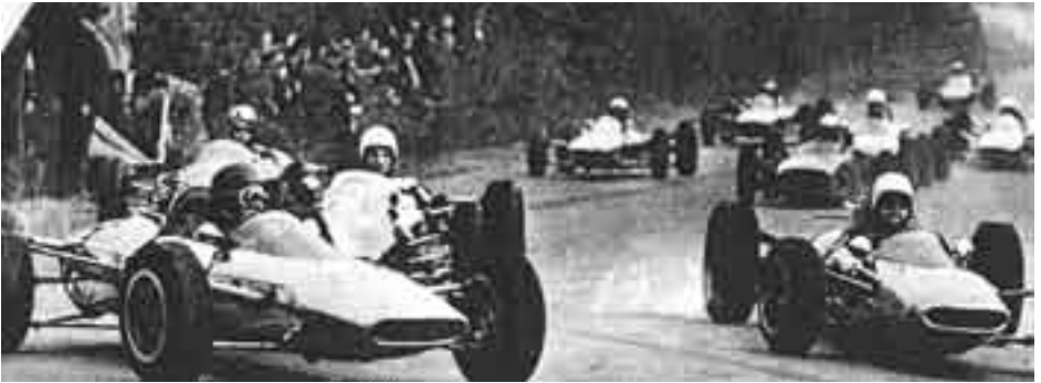
Formel 3-Rennwagen auf der Halle-Saale-Schleife 1966