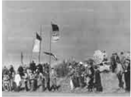
Zuschauer auf der Halle-Saale-Schleife, im Hintergrund der Sprungturm