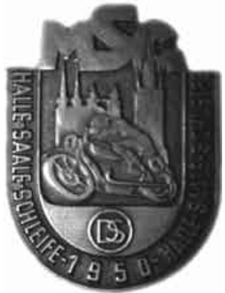
Die zur ersten Halle-Saale-Schleife herausgegebene Plakette

Die vorgelegten Baupläne wurden genehmigt, und auch dem Kostenzuschuss von 135000 DM stimmten die Stadtväter zu. Mit großer Begeisterung gingen die Sportler daraufhin an die Arbeit.