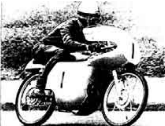
Walter Brehme gehörte in den fünfziger und sechziger Jahren zum MZ-Werksteam und zur Weltspitze