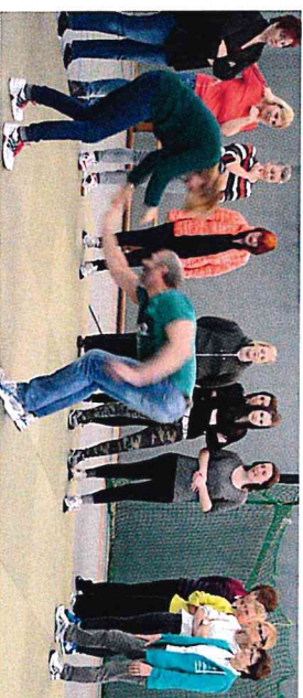
Kurs beim Plattenberger TV (Sieger im Vereinswettbewerb 2016)

Der Deutsche Olympische Sportbund möchte vorbildhafte Kooperationen zwischen Sportvereinen und lokalen Aktionspartner/innen sichtbar machen. Ausgezeichnet werden daher Sportvereine, die sich im Rahmen der DOSB-Aktion mit Aktionspartner/innen vernetzen und gemeinsam über die Ursachen von Gewalt an Frauen informieren, auf notwendige Hilfe- und Präventionsmaßnahmen aufmerksam machen und ein starkes Bündnis gegen Gewalt knüpfen.